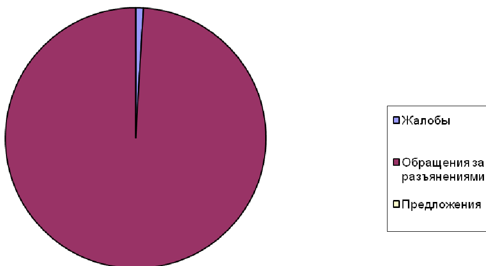
Структура обращений застрахованных лиц за первое полугодие 2019 года